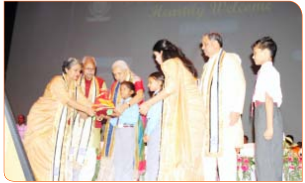
प्राथमिक स्कूल के बच्चे को पुस्तकें व पोषण सामग्री प्रदान करते हुए राज्यपाल जी