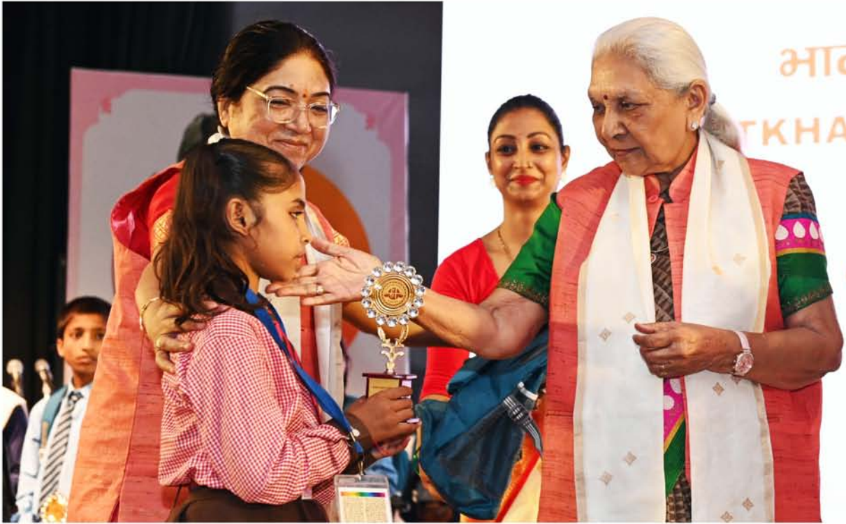
प्राथमिक विद्यालय के बच्चे को स्कूल बैग व पठन-पाठन सामग्री वितरित करते हुए राज्यपाल जी।