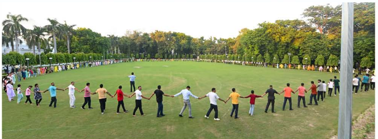
राजभवन में आयोजित स्वच्छता सेवा संस्कार पखवाड़ा में मानव श्रृंखला बनाकर स्वच्छता के प्रति जागरूकता का संदेश देते राजभवन के कार्मिक एवं विश्वविद्यालय के छात्र-छात्राएं।