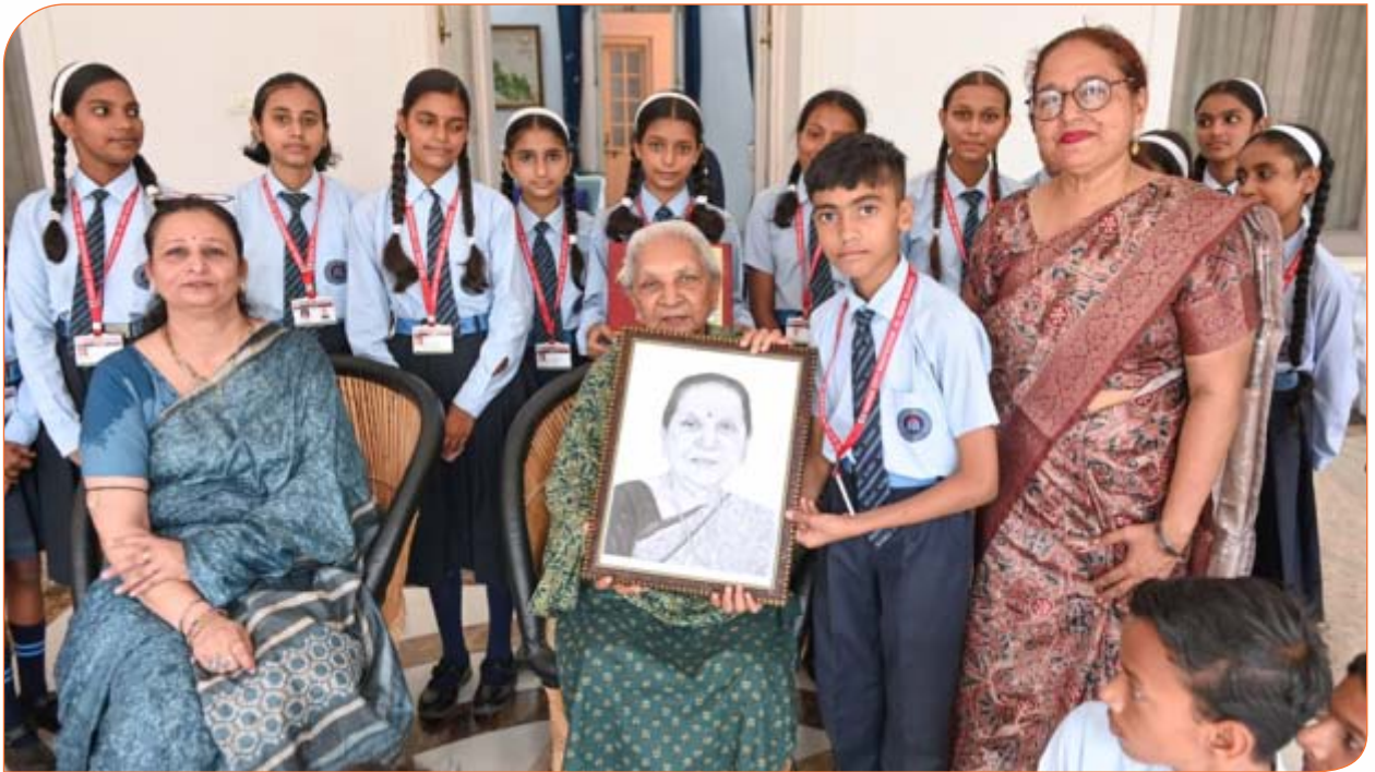
सैगल सिटी मांटेसरी जूनियर हाई स्कूल, सीतापुर के बच्चे राजभवन भ्रमण के दौरान राज्यपाल जी को पेंसिल से बनायी उनकी तस्वीर भेंट करते हुए। 09 सितम्बर, 2024