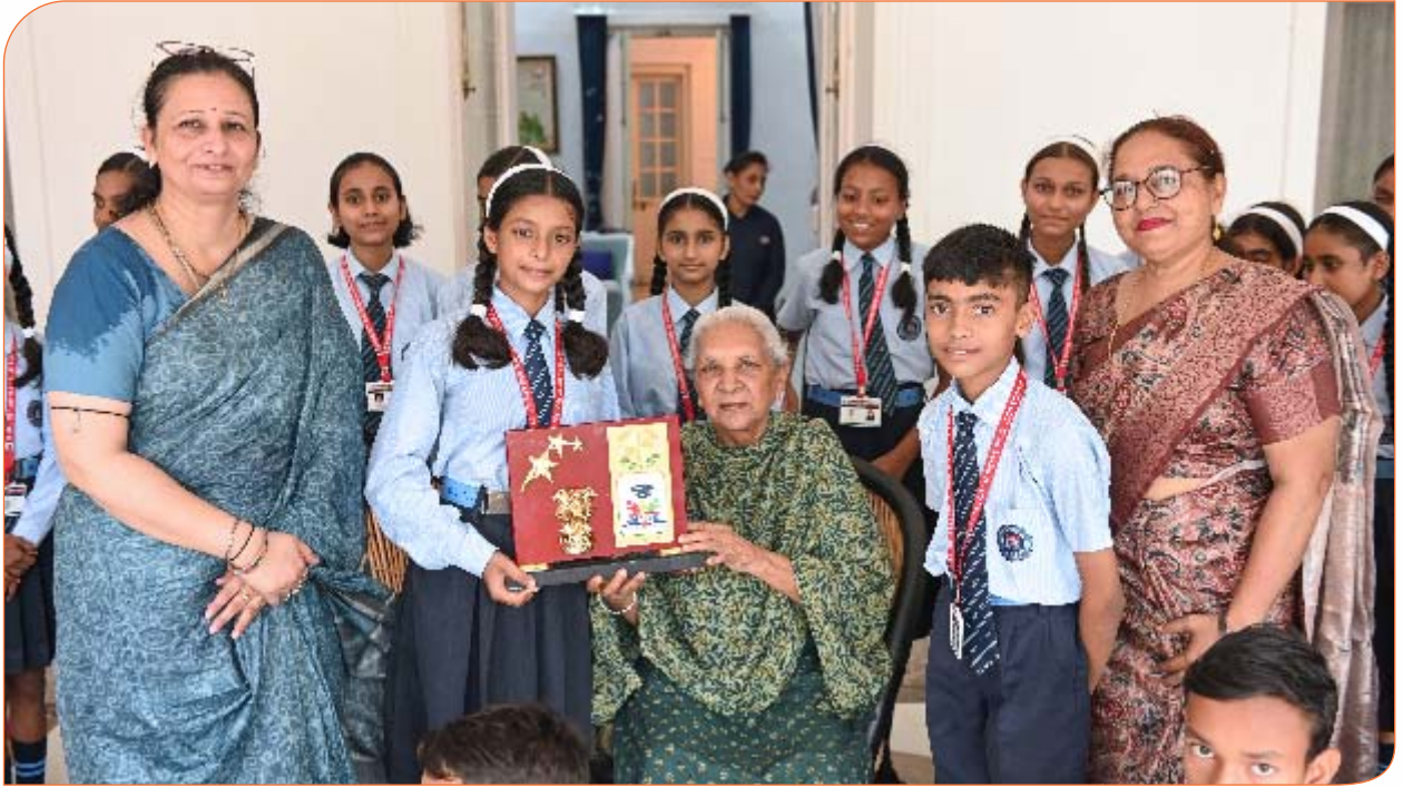
सैगल सिटी मांटेसरी जूनियर हाई स्कूल, सीतापुर के बच्चे राजभवन भ्रमण के दौरान राज्यपाल जी को स्मृति चिन्ह भेंट करते हुए। 09 सितम्बर, 2024