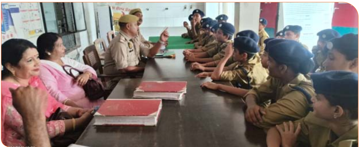
राजभवन स्थित उच्च प्राथमिक विद्यालय के बच्चे शैक्षिक भ्रमण के दौरान