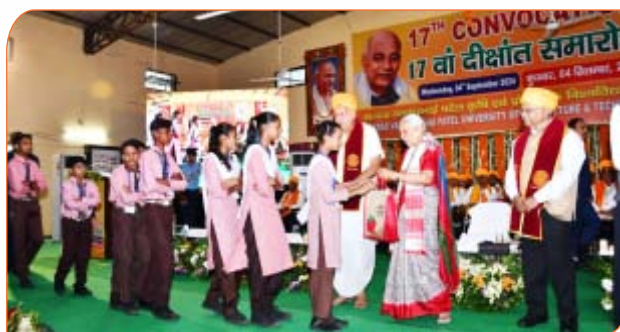
प्राथमिक विद्यालय के बच्चों को उपहार को उपहार वितरित करते हुए राज्यपाल जी