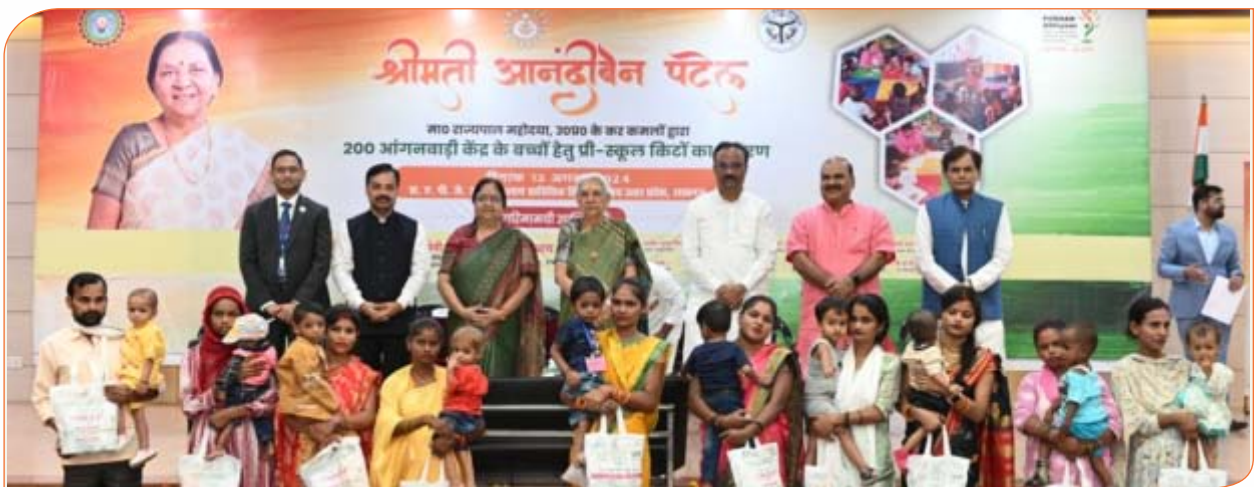
पोषण किट प्राप्त करने वाले कुपोषित बच्चों व उनकी माताओं के साथ राज्यपाल जी।