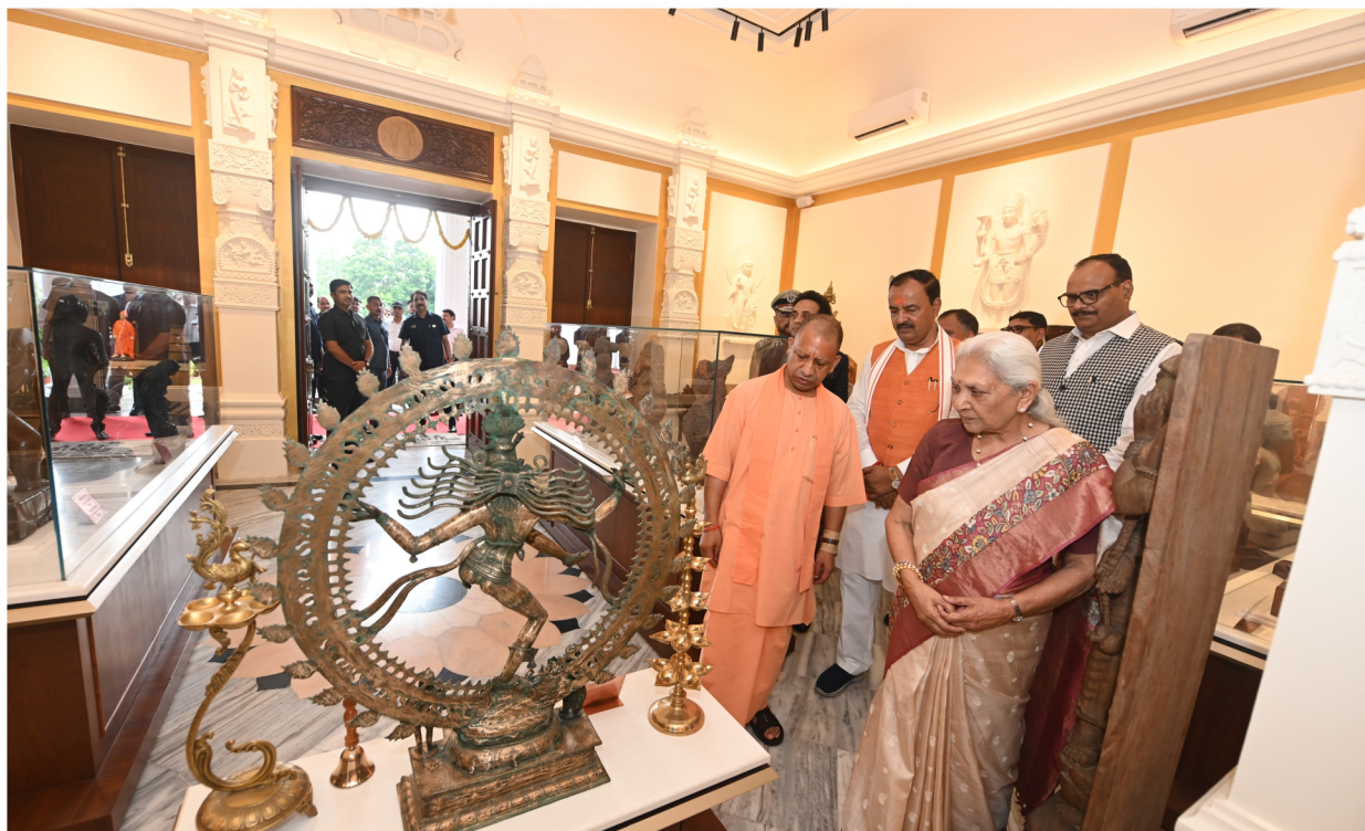
राजभवन के नवीनीकृत कला कक्ष में विभिन्न दुर्लभ, प्राचीन व नवीनतम कलाकृतियां का अवलोकन करते हुए