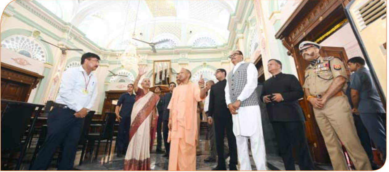
अन्नपूर्णा कक्ष का अवलोकन करते हुए