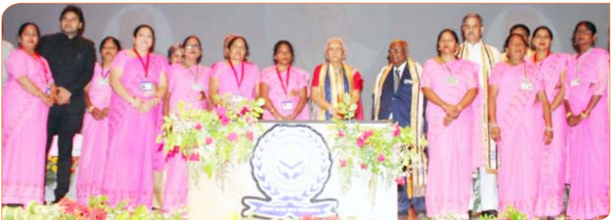
स्वामी विवेकानंद सुभारती विश्वविद्यालय, मेरठ के दीक्षांत समारोह के अवसर पर आंगनवाड़ी किट प्राप्त करने के पश्चात आंगनवाड़ी कार्यकर्त्रियां राज्यपाल जी के साथ।