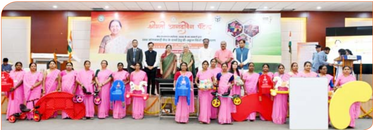
डॉ० ए०पी०जे० अब्दुल कलाम प्राविधिक विश्वविद्यालय, लखनऊ में आंगनवाड़ी कार्यकर्त्रियों के साथ राज्यपाल जी।