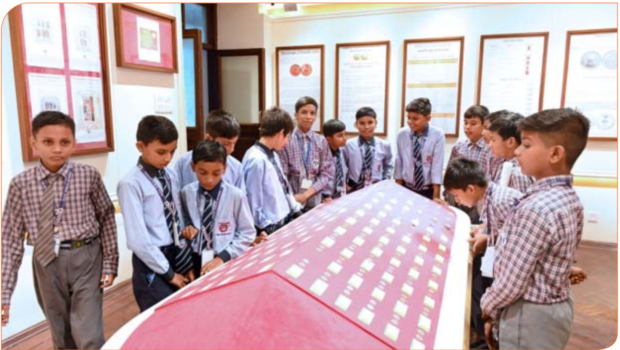
बी0एस0एस0 पब्लिक स्कूल, रायबरेली के बच्चे स्टाम्प एवं मुद्रा के बारे में जानकारी प्राप्त करते हुए। 26 सितम्बर, 2024