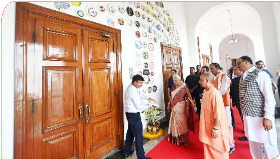
अन्नपूर्णा व तृप्ति कक्ष की बाहरी दीवारों पर लगी आकर्षक डिजाइन युक्त सेरेमिक प्लेटों का अवलोकन