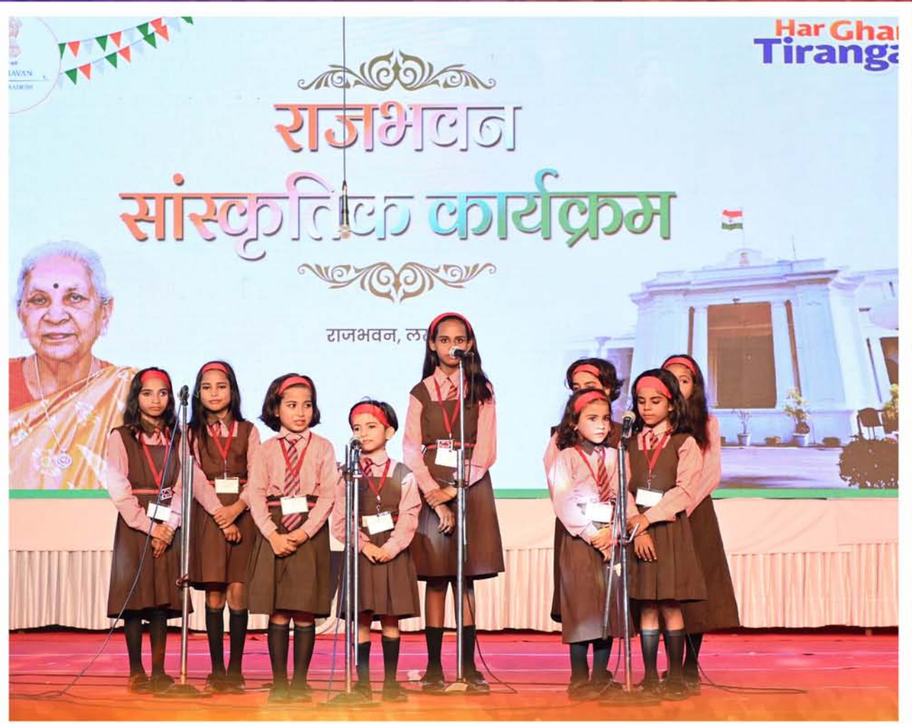
स्वतंत्रता दिवस के अवसर पर राजभवन में आयोजित सांस्कृतिक कार्यक्रम में प्रस्तुति देते हुए बच्चे।