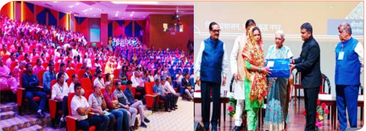
गर्भवती माताओं को पोषण पोटली वितरित करते हुए राज्यपाल जी।