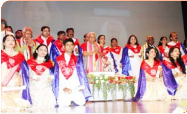
स्वामी विवेकानंद सुभारती विश्वविद्यालय, मेरठ के दीक्षांत समारोह में पदक प्राप्तकर्ता मेधावी विद्यार्थियों के साथ।