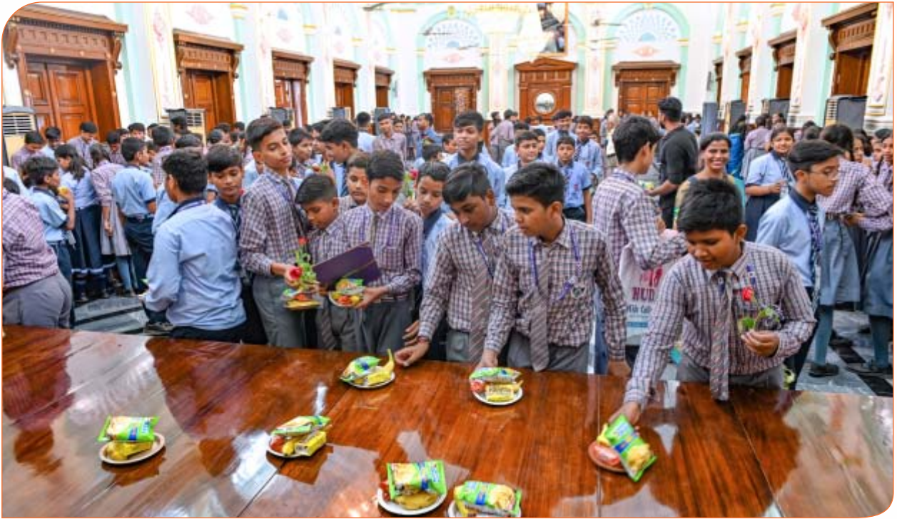
बी0एस0एस0 पब्लिक स्कूल, रायबरेली के विद्यार्थी राजभवन भ्रमण के दौरान अन्नपूर्णा कक्ष में नाश्ता करते हुए। 26 सितम्बर, 2024