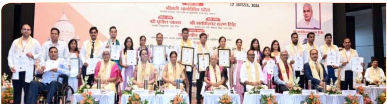
किंग जार्ज चिकित्सा विश्वविद्यालय के दीक्षान्त समारोह में पदक एवं उपाधि प्राप्त करने वाले मेधावी छात्र-छात्राओं के साथ।