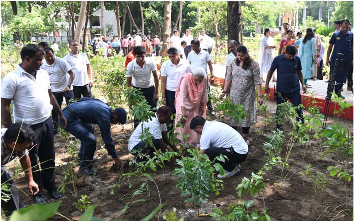
राजभवन में स्थापित मियावाकी वन में पौध रोपण करते हुए राज्यपाल जी।