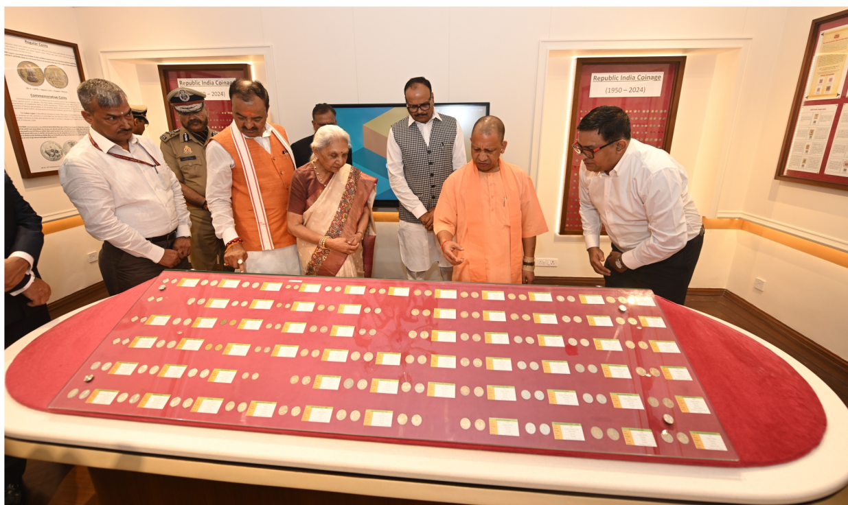
राजभवन में नवनिर्मित स्टाम्प व मुद्रा कक्ष में स्मारक डाक टिकट तथा प्राचीन सिक्कों की विविधता का अवलोकन करते हुए राज्यपाल आनन्दी बेन पटेल जी एवं मुख्यमंत्री योगी आदित्यनाथ जी