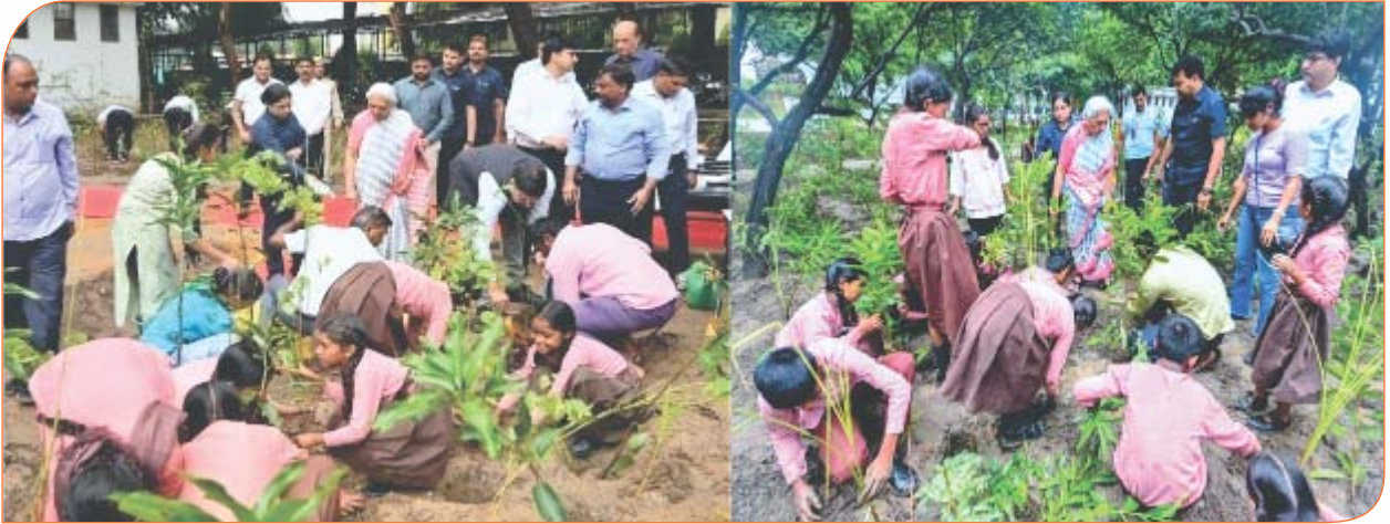
राजभवन में 'मियावाकी वन' के विस्तार कार्यक्रम में बच्चों के साथ पौधा रोपण करते हुए।

पेड़-पौधे हमारे जीवन का अभिन्न हिस्सा हैं और ये हमारे अस्तित्व के लिए अत्यधिक महत्वपूर्ण हैं। प्राचीन काल में ऋषि-मुनियों की साधना प्रकृति के बीच होती थी, जहाँ वे वृक्षों और हरियाली के सानिध्य में ध्यान और तपस्या करते थे। यह हमें यह सिखाता है कि प्रकृति से जुड़कर हम मानसिक और शारीरिक शांति प्राप्त कर सकते हैं। इस दृष्टि से, यह हमारा कर्तव्य बनता है कि हम वृक्षारोपण और पर्यावरण संरक्षण के प्रति अपनी जिम्मेदारी निभाएं, ताकि आने वाली पीढ़ियाँ भी इस हरे-भरे और स्वस्थ पर्यावरण का लाभ उठा सकें।