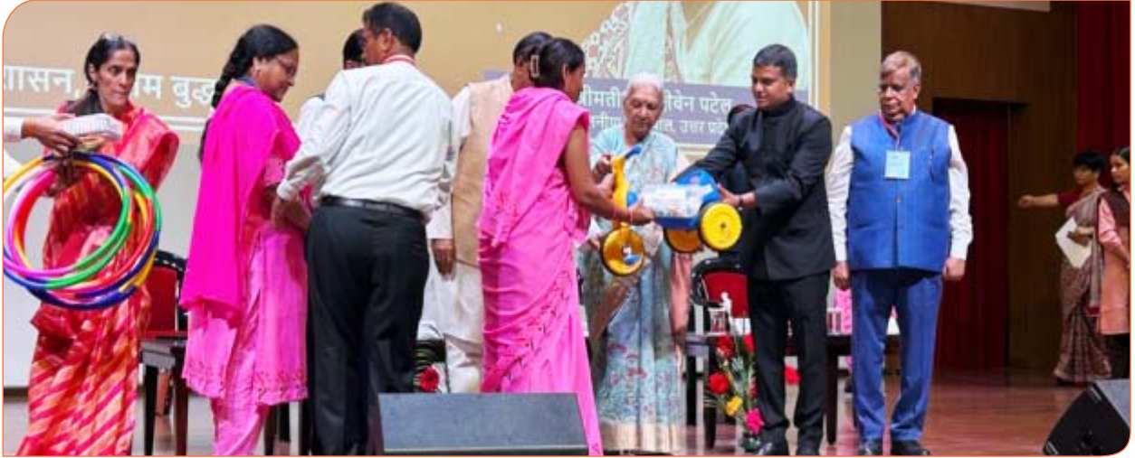
गौतमबुद्ध नगर में आंगनवाड़ी कार्यकर्त्रियों को किट प्रदान करते हुए राज्यपाल।