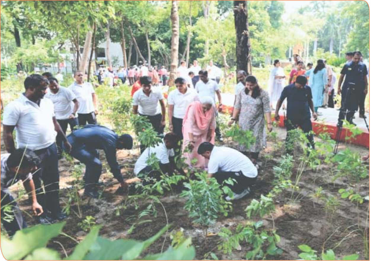
राजभवन में स्थापित मियावाकी वन में पौधरोपण करते हुए राज्यपाल जी।