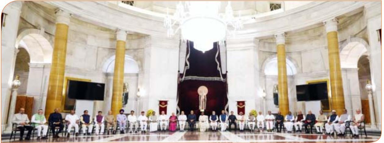
राष्ट्रपति भवन, नई दिल्ली में आयोजित राज्यपाल सम्मेलन में मा० राष्ट्रपति, मा० उप राष्ट्रपति, मा० प्रधानमंत्री, मा० गृहमंत्री एवं सभी राज्यों के राज्यपालगण

“राज्यों के समग्र और त्वरित विकास में ही देश का विकास निहित है। सभी राज्यों को एक दूसरे की इमेज चतर्बजपबमे एवं अनुभवों से सीखते हुए आगे बढ़ना है। राज्यपाल, राज्य सरकारों के अंतर्गत आने वाले अधिकांश विश्वविद्यालयों के कुलाधिपति हैं। विद्यार्थियों के भविष्य को सुधारने में राज्यपालों की बहुत बड़ी भूमिका है। इस भूमिका को अच्छी तरह निभाने के लिए राज्यपाल, कुलपतियों से विचार-विमर्श करके उच्च-शिक्षण संस्थानों में सुधार ला सकते हैं।”