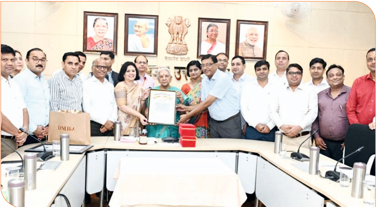
नैक मूल्यांकन में उच्चतम ग्रेड 'A++' प्राप्त करने पर चौधरी चरण सिंह विश्वविद्यालय, मेरठ की नैक टीम को 10 जुलाई, 2023 को राजभवन में प्रशस्ति-पत्र देकर सम्मानित करते हुए राज्यपाल श्रीमती आनंदीबेन पटेल जी।