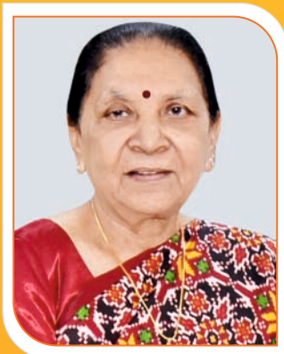
श्रीमती आनंदीबेन पटेल