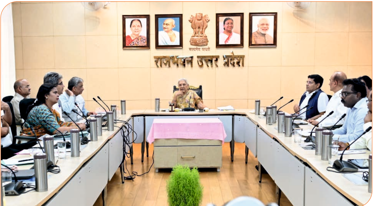
सरदार वल्लभभाई पटेल कृषि एवं प्रौद्योगिकी विश्वविद्यालय, मेरठ के नैक मूल्यांकन हेतु तैयारियों की समीक्षा करते हुए राज्यपाल जी।