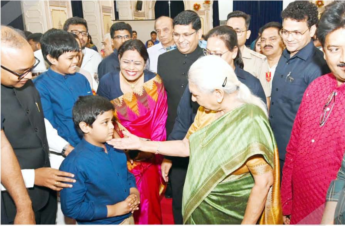
तेलंगाना समाज के लोगों से आत्मीय मुलाकात के समय राज्यपाल जी का बच्चे को ममतामयी दुलार ।