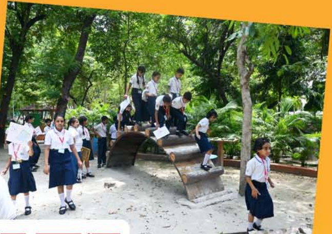
विद्यार्थियों का राजभवन, लखनऊ भ्रमण