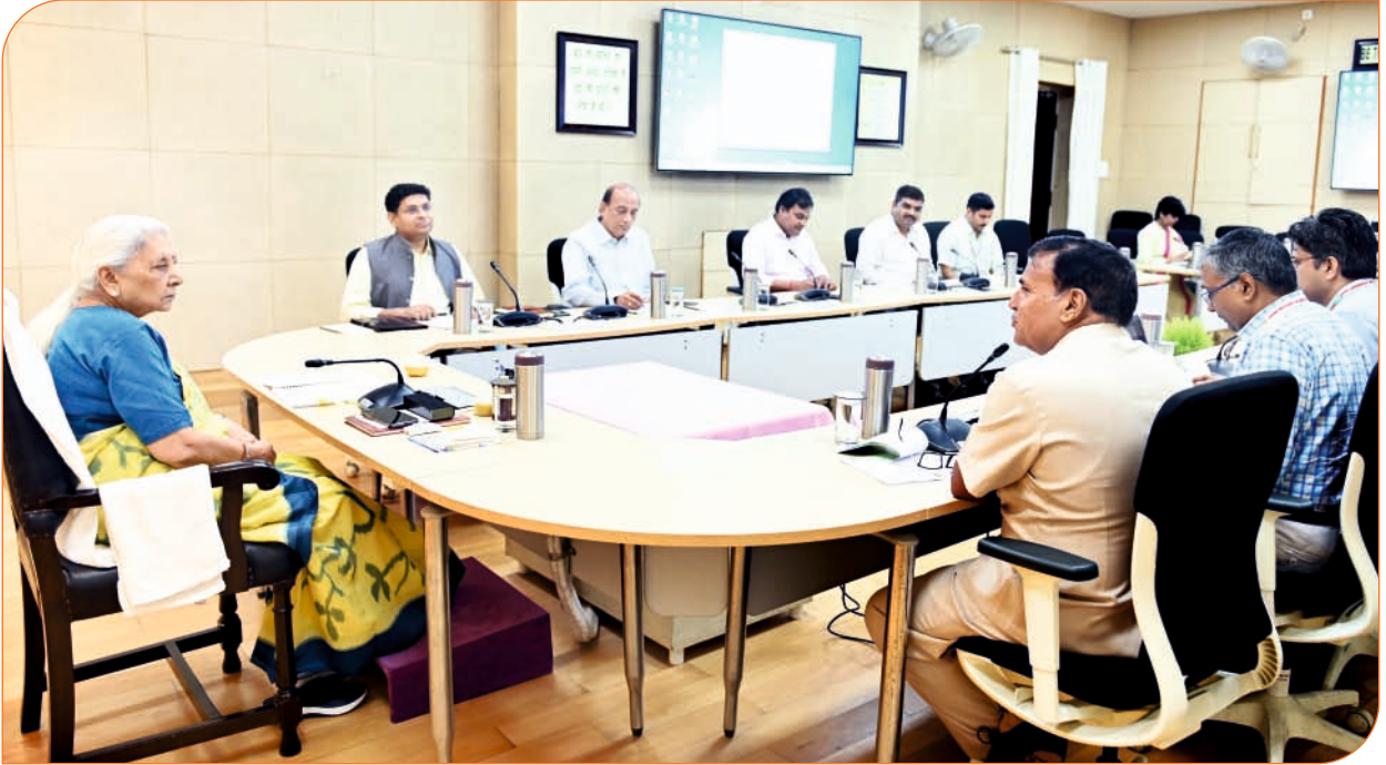
बांदा कृषि एवं प्रौद्योगिकी विश्वविद्यालय, बांदा के नैक मूल्यांकन हेतु तैयारियों की समीक्षा करते हुए राज्यपाल जी।