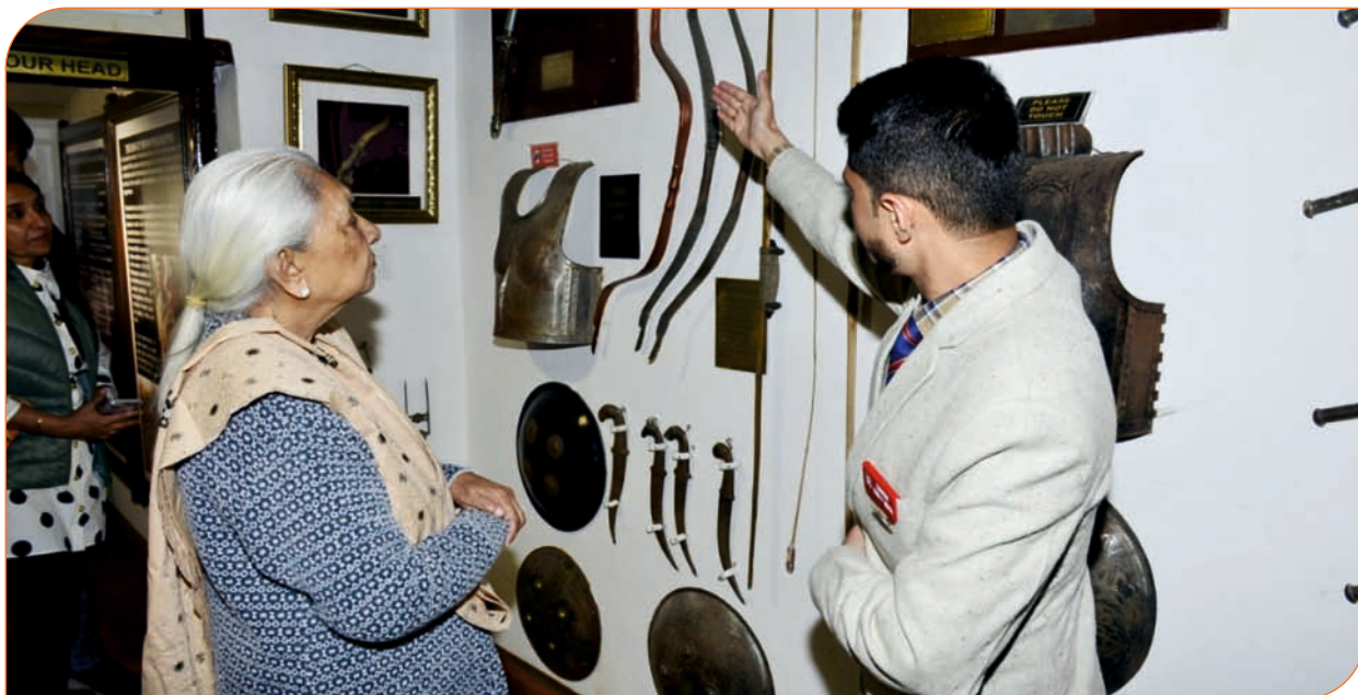
अन्नडेल आर्मी हेरिटेज म्यूजियम, शिमला में संरक्षित प्राचीन वस्तुओं का अवलोकन कर जानकारी प्राप्त करते हुए राज्यपाल जी।