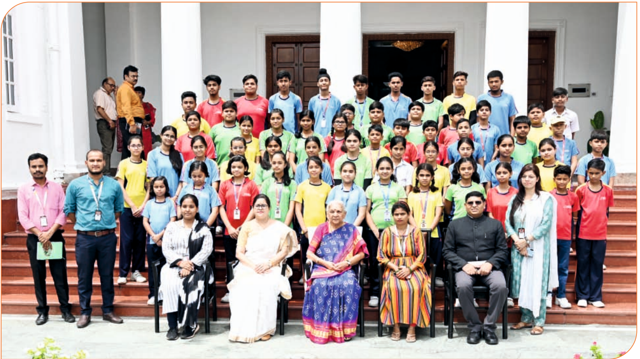
राजभवन भ्रमण पर आये सेठ एम0आर0 जयपुरिया स्कूल, बहराइच के विद्यार्थियों और शिक्षकों के साथ राज्यपाल श्रीमती आनंदीबेन पटेल (ग्रुप-3)।