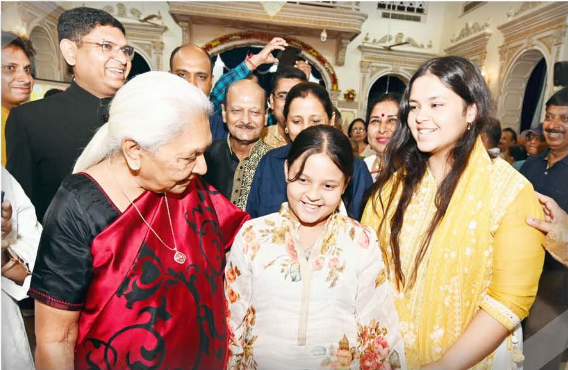
बंगाली समाज के लोगों से राज्यपाल श्रीमती आनंदीबेन पटेल की आत्मीय मुलाकात।