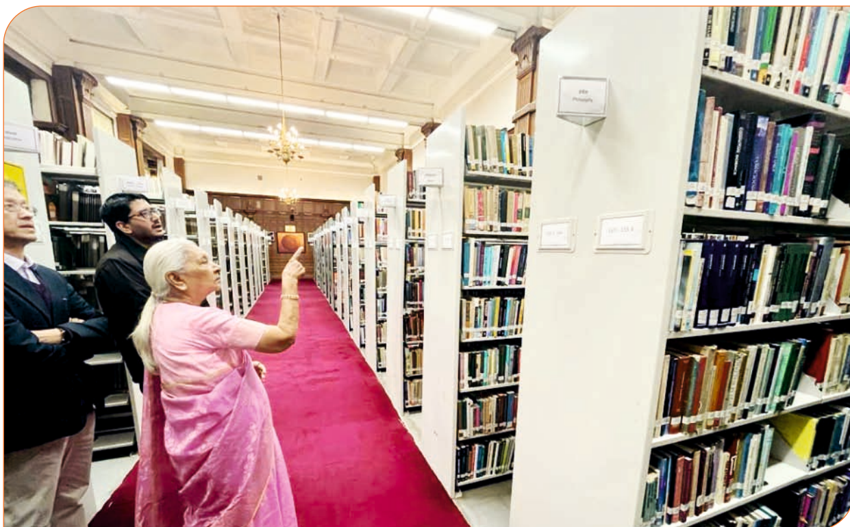
राज्यपाल जी इण्डियन इंस्टीट्यूट ऑफ एडवांस स्टडीज, शिमला के समृद्ध पुस्तकालय में उपलब्ध पुस्तकों के संबंध में जानकारी प्राप्त करते हुए।