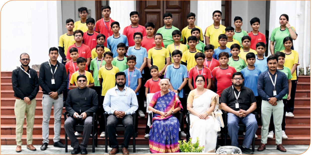
राजभवन भ्रमण पर आये सेठ एम0आर0 जयपुरिया स्कूल, बहराइच के विद्यार्थियों और शिक्षकों के साथ राज्यपाल श्रीमती आनंदीबेन पटेल (ग्रुप-2)।