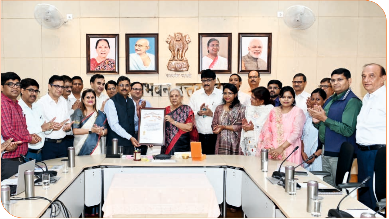
राज्यपाल जी ए+ ग्रेडिंग प्राप्त हरकोट बटलर प्राविधिक विश्वविद्यालय, कानपुर की टीम को 28 जून, 2023 को राजभवन, लखनऊ में प्रशस्ति पत्र भेंट कर सम्मानित करते हुए।