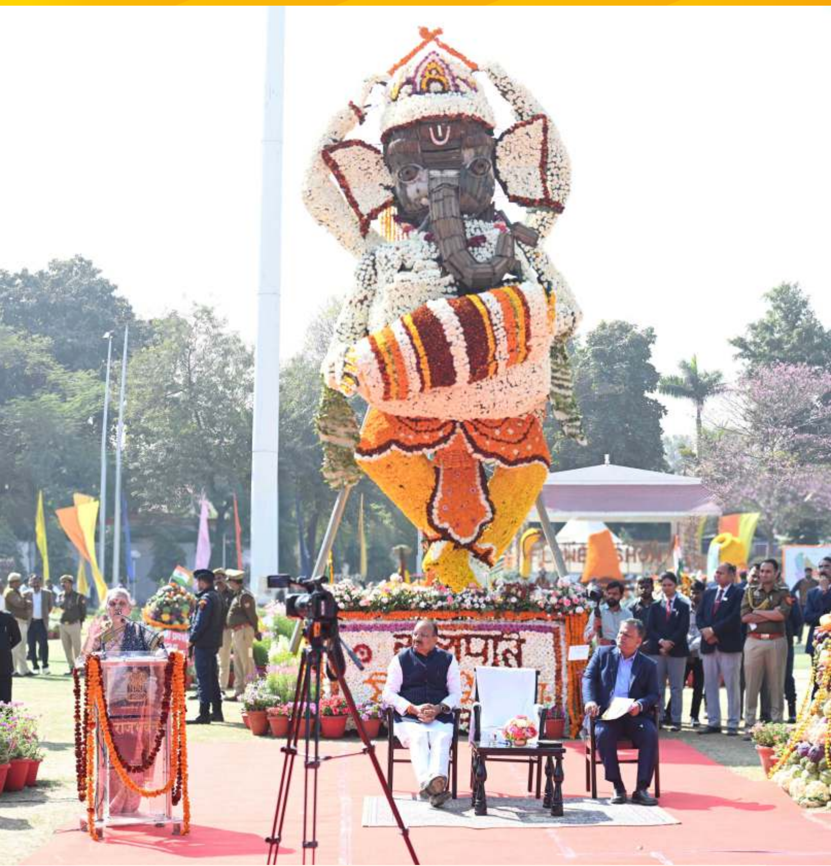
राजभवन प्रादेशिक फल, शाकभाजी एवं पुष्प प्रदर्शनी 2025 के उद्घाटन कार्यक्रम को सम्बोधित करते हुए राज्यपाल जी।