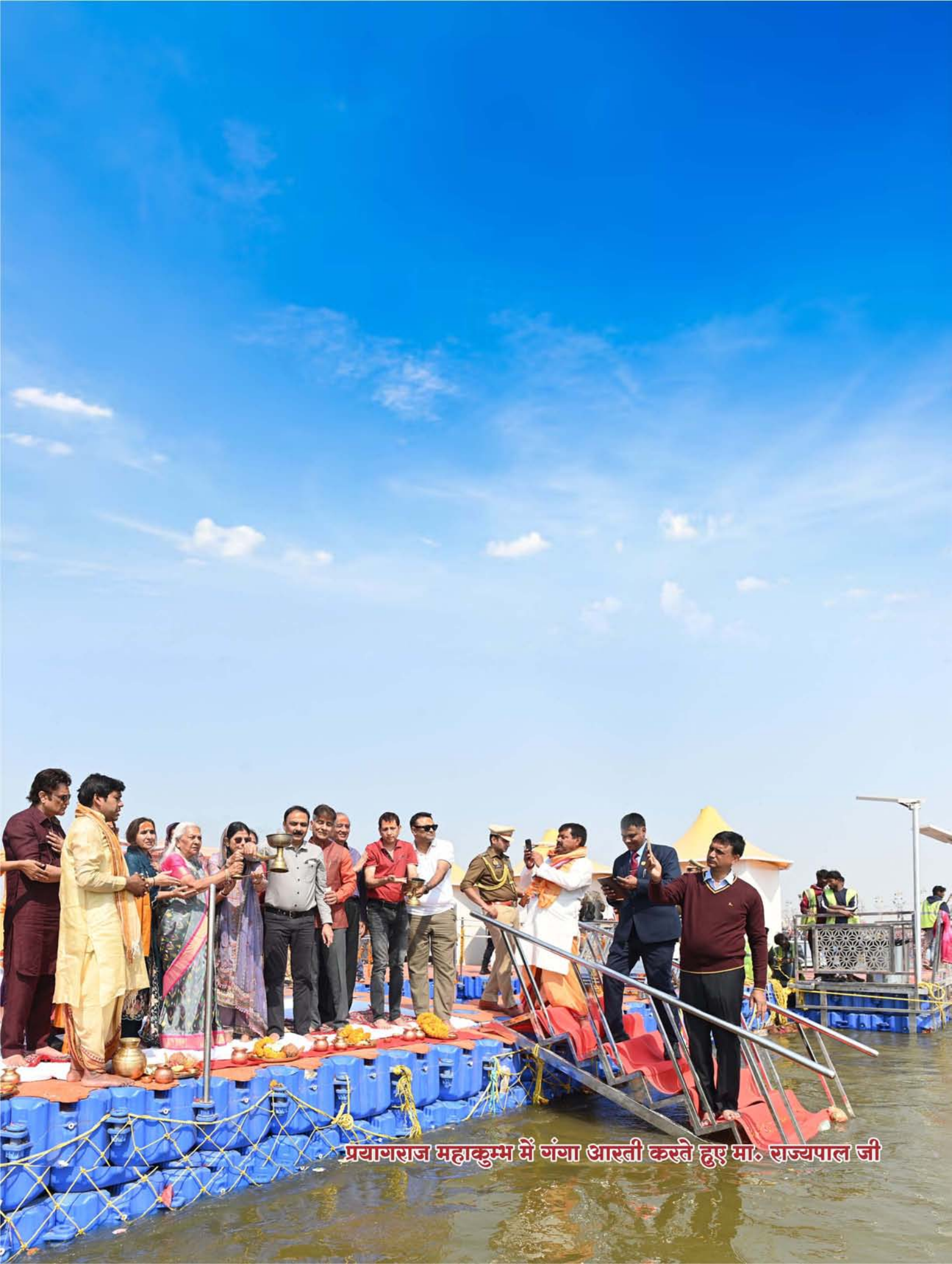
प्रयागराज महाकुम्भ में गंगा आरती करते हुए मा. राज्यपाल जी