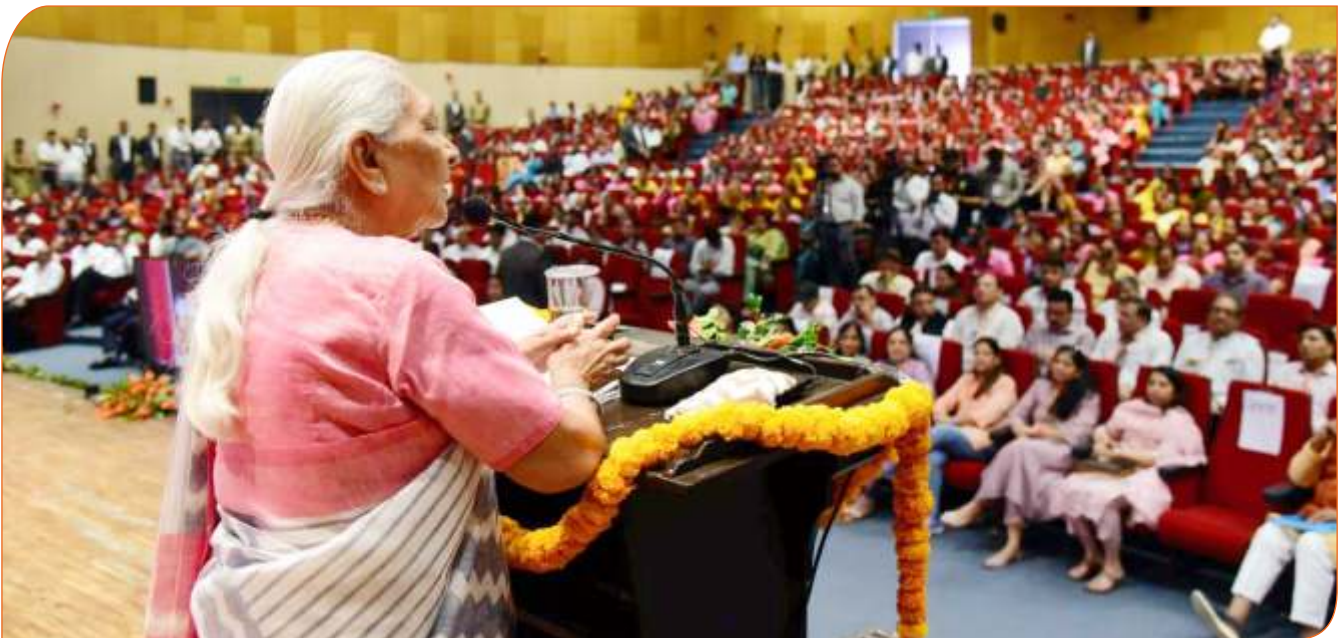
जनपद गौतमबुद्ध नगर में आयोजित एच0पी0वी0 वैक्सीनेशन कार्यक्रम में उपस्थित लोगों को सम्बोधित करते हुए राज्यपाल जी।

“सर्वाइकल कैंसर महिलाओं के लिए एक घातक बीमारी है, लेकिन इससे बचाव संभव है एचपीवी (ह्यूमन पैपिलोमा वायरस) वैक्सीनेशन के माध्यम से। इस दिशा में परिवारों, समाज, जनप्रतिनिधियों और उद्यमियों को मिलकर आगे आना होगा। कॉरपोरेट जगत अपने सीएसआर फंड का अधिकतम उपयोग स्वास्थ्य सेवाओं, विशेषकर एचपीवी वैक्सीनेशन जैसे महत्वपूर्ण पहल में करे। यह प्रधानमंत्री श्री नरेंद्र मोदी जी के विकसित भारत के सपने को साकार करने की दिशा में एक सशक्त कदम होगा। हम सब मिलकर अपनी बेटियों को इस गंभीर बीमारी से सुरक्षित करें और पूरे समाज को एचपीवी वैक्सीनेशन के प्रति जागरूक बनाएं। स्वस्थ बेटि, सुरक्षित भविष्य यही है विकसित भारत की असली पहचान।”