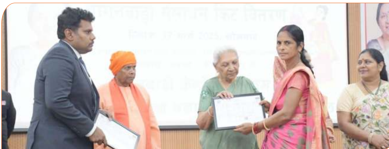
जनपद सिद्धार्थनगर में ग्रामीण आवास अभिलेख (घरौनी) की लाभार्थी महिला को घरौनी का प्रमाण पत्र प्रदान करते हुए राज्यपाल जी।