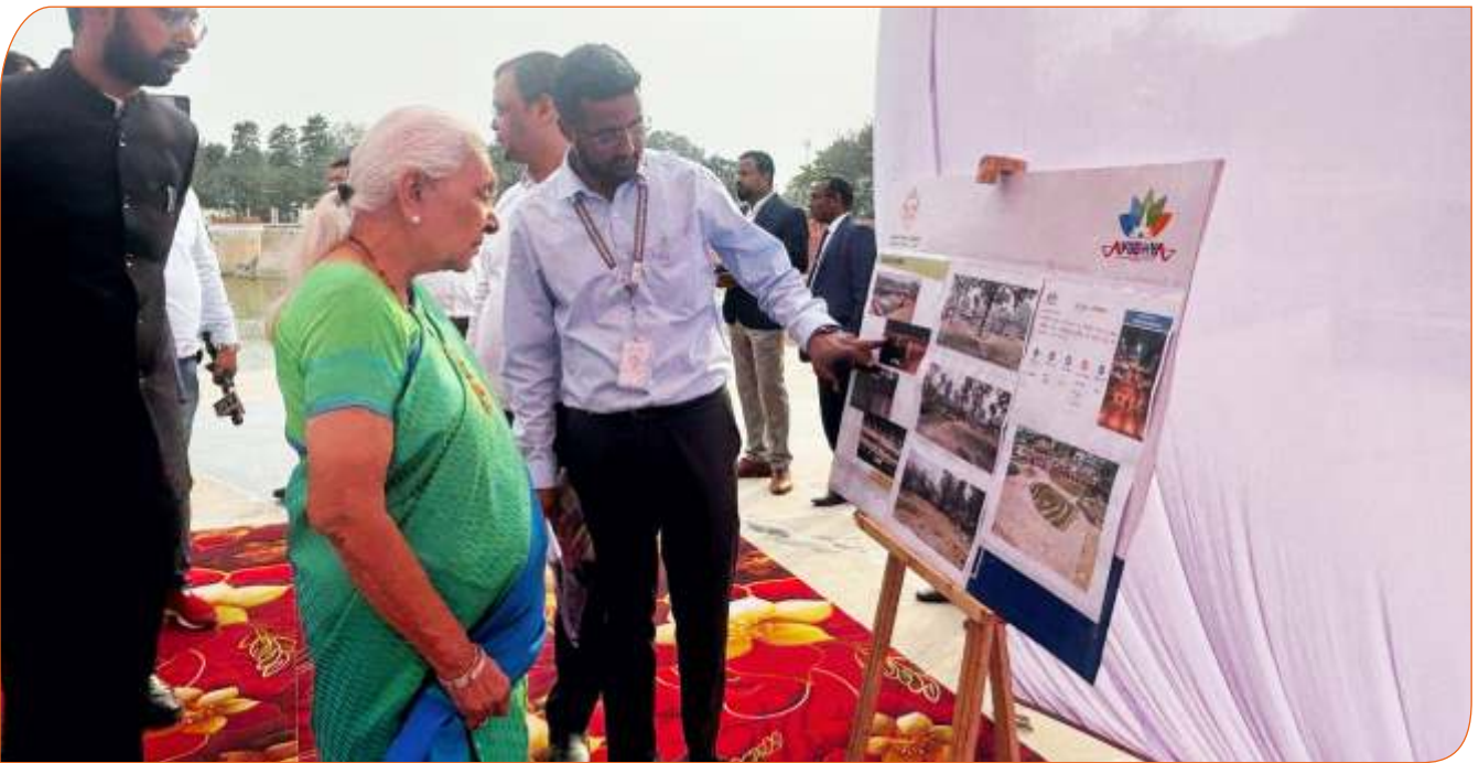
जनपद अयोध्या स्थित सूर्यकुण्ड के जीर्णोद्धार के संबंध में जानकारी प्राप्त करते हुए राज्यपाल जी।