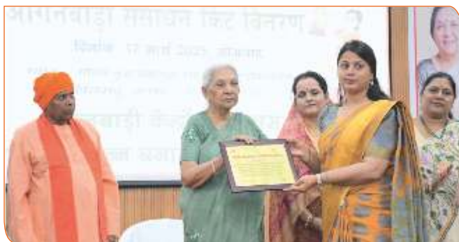
जनपद सिद्धार्थनगर में क्षय रोगी गोद लेने वाली निक्षय मित्र महिला को प्रशस्ति पत्र प्रदान करते हुए राज्यपाल जी।