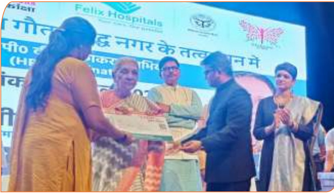
लाभार्थी को आयुष्मान कार्ड प्रदान करते हुए राज्यपाल जी