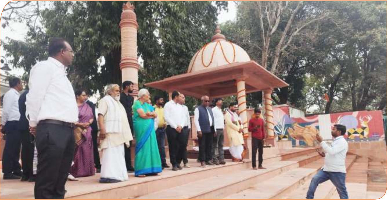
जनपद अयोध्या में स्थित प्राचीन सीताकुण्ड का भ्रमण करते हुए राज्यपाल जी।