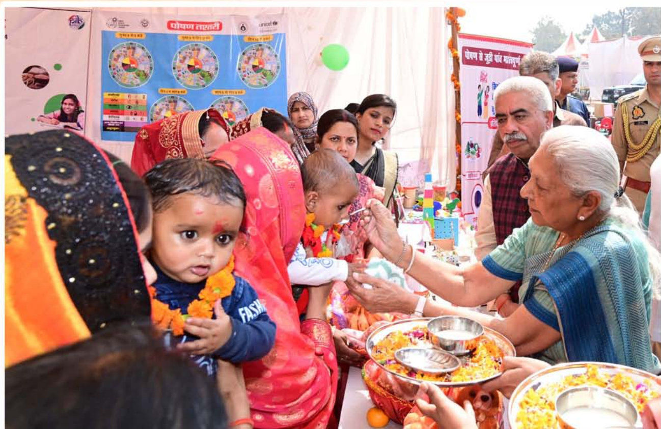
आंगनवाड़ी केन्द्र पर बच्चों को अन्नप्राशन संस्कार कराते हुए राज्यपाल जी।