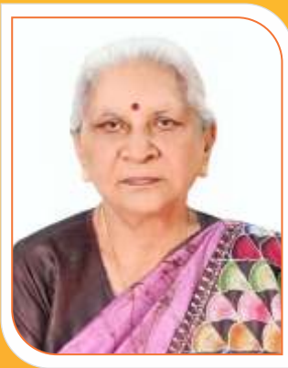
श्रीमती आनंदीबेन पटेल मा. राज्यपाल, उत्तर प्रदेश