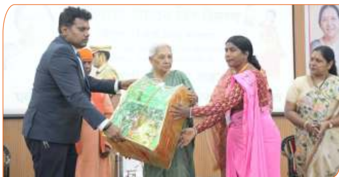
जनपद सिद्धार्थनगर में आंगनबाड़ी केन्द्रों को सशक्त बनाने हेतु कार्यकर्ता को आंगनबाड़ी किट प्रदान करते हुए राज्यपाल जी।