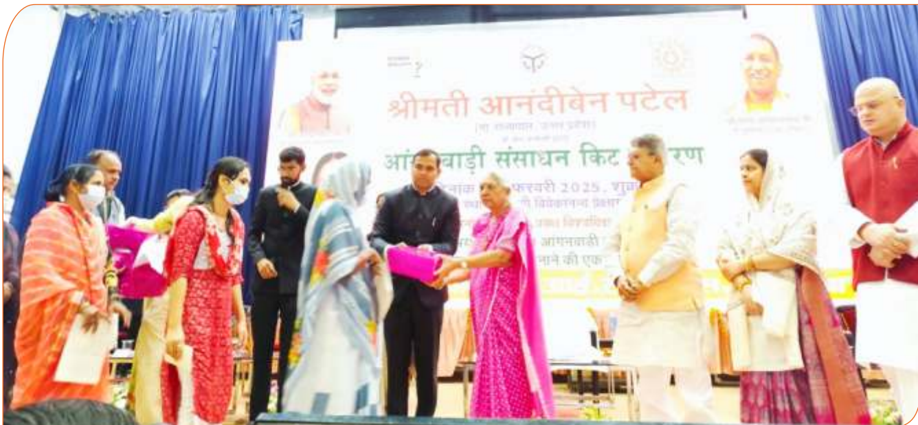
टी0बी0 मरीजों के लिए पोषण पोटली प्रदान करते हुए राज्यपाल जी।

“जिस तत्कार एक माली नन्हे पौधे की सावधानीपूर्वक देखभाल कर उसे मजबूत और बड़ा करता है, उसी तत्कार बच्चों का भी तत्कार से ही समुचित लालन-पालन आवश्यक है। यह माता-पिता की मूल जिम्मेदारी है कि वे अपने बच्चों को उन्नत संस्कार और सकारात्मक वातावरण तत्दान करें। इसी उद्देश्य को द्रष्टान में रखते हुए आंगनवाड़ियों में गर्भ-संस्कार की शुद्भात की गई है, ताकि गर्भावस्था के दौरान ही माअपने शिशु को शांत और सकारात्मक माहौल दे सके।