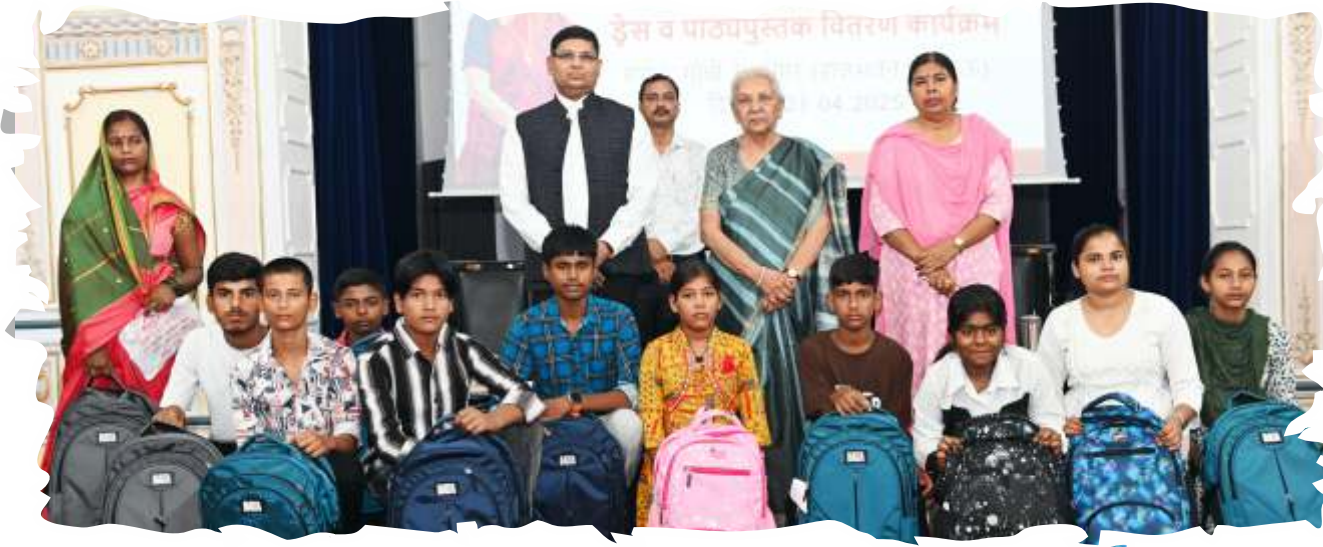
कक्षा-9 में प्रवेश कराने के उपरांत बैग, पुस्तकें एवं ड्रेस का वितरण करते हुए राज्यपाल जी।