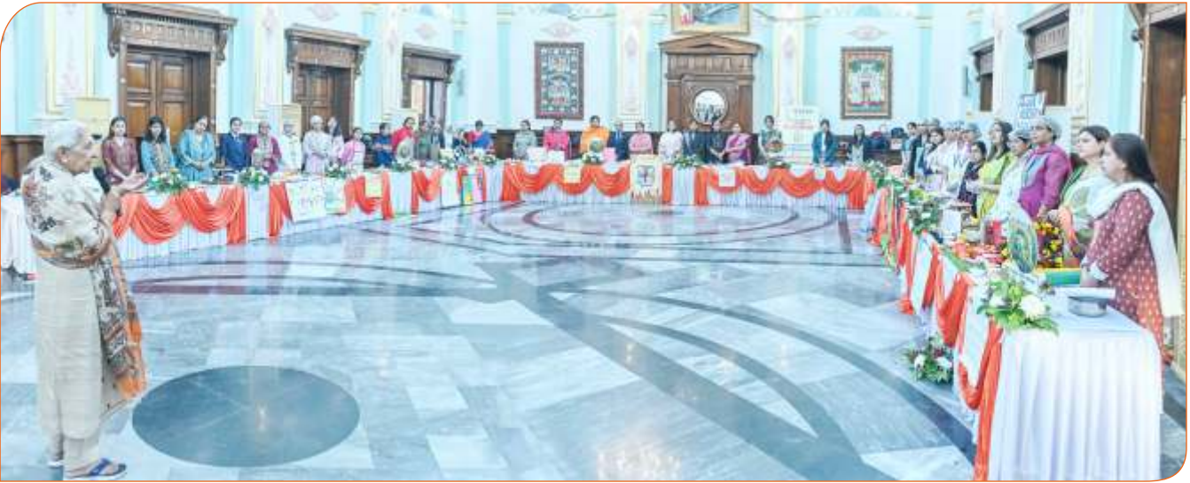
राजभवन में 'श्री अन्न' प्रतियोगिता के प्रतिभागियों को सम्बोधित करते हुए राज्यपाल जी।

“स्वस्थ जीवनशैली के लिए संतुलित आहार अनिवार्य है और मिलेट जैसी पारंपरिक खाद्य सामग्री को आहार में पुनः शामिल करने के लिए इस प्रकार की प्रतियोगिताएं जागरूकता बढ़ाने का प्रभावी माध्यम हैं। बाल्यावस्था, गर्भावस्था और वृद्धावस्था में पोषण की आवश्यकताएं भिन्न होती हैं, जिन्हें समझकर उचित आहार लेना जरूरी है।”