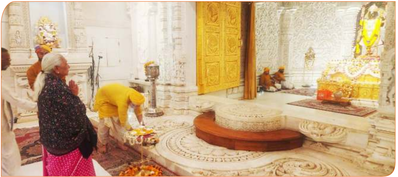
जनपद अयोध्या में प्रभु श्रीराम के मंदिर में दर्शन एवं पूजन करते हुये राज्यपाल जी।