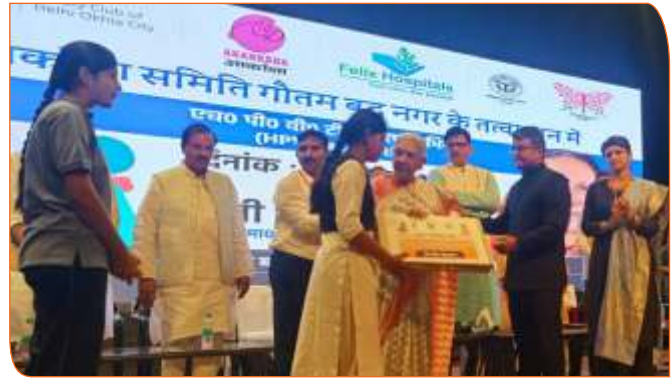
मेधावी छात्रा को लैपटॉप प्रदान करते हुए राज्यपाल जी।