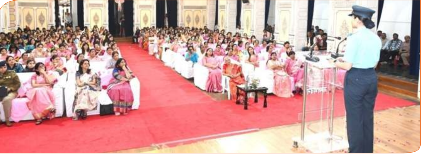
अंतर्राष्ट्रीय महिला दिवस के अवसर पर राजभवन में अपने अनुभव साझा करते हुए सैन्य अधिकारी