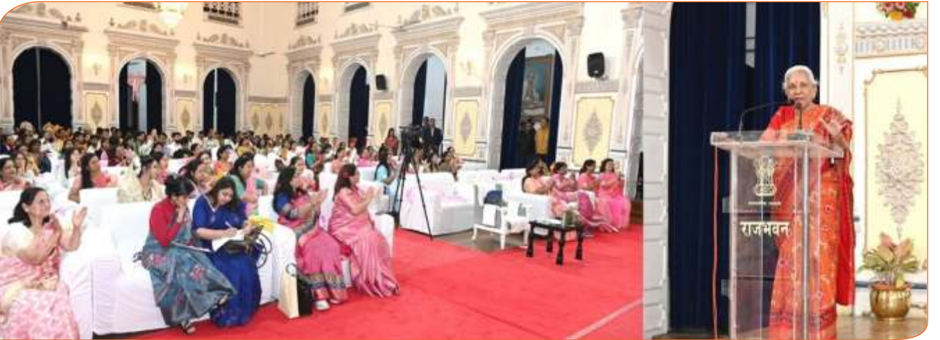
अंतर्राष्ट्रीय महिला दिवस पर राजभवन में आयोजित कार्यक्रम में विशेष रूप से आमंत्रित महिलाओं को सम्बोधित करते हुए राज्यपाल जी।