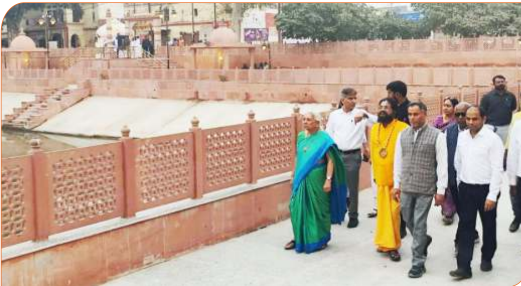
जनपद अयोध्या में स्थित प्राचीन विद्याकुण्ड का भ्रमण करते हुए राज्यपाल जी।