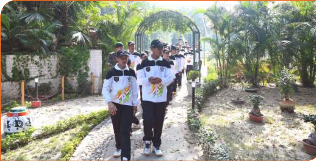
सैनिक स्कूल के बच्चे राजभवन भ्रमण के दौरान। 04 फरवरी, 2025